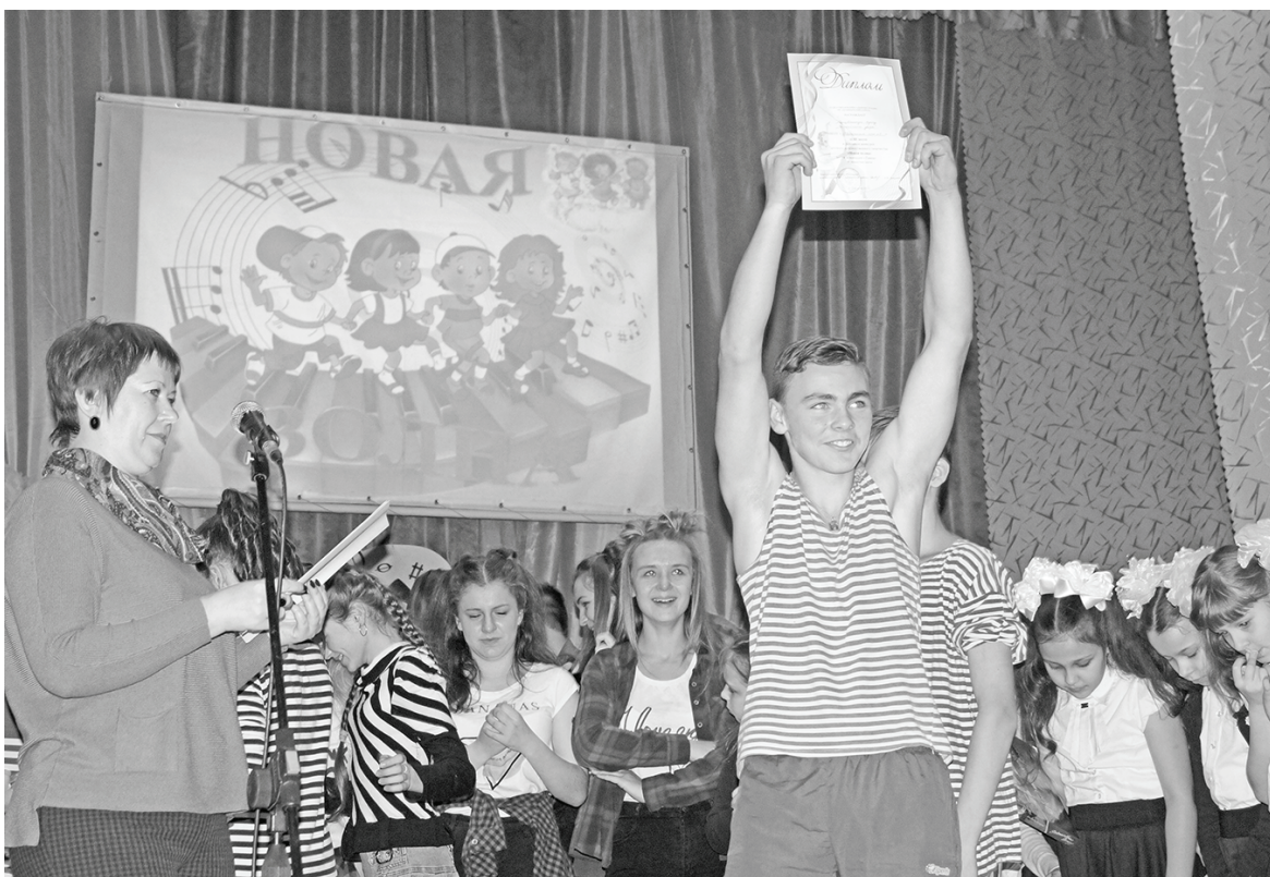
Диплом за 3 место у «Волшебников двора» (Паликская СОШ №1).