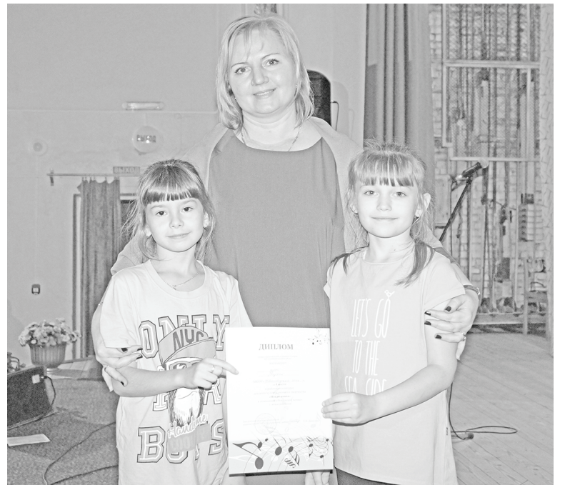
«Радость» - победители из Новослободска.

После вокального состязания всем уже хотелось большего дви-